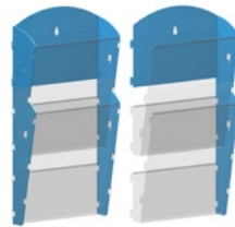
MK 2 A4 PP Základní díl (Base column) MK 2 A4 PP Přídavný díl (Additional column) MK 2 A5 PP Základní díl (Base column) MK 2 A5 PP Přídavný díl (Additional column)