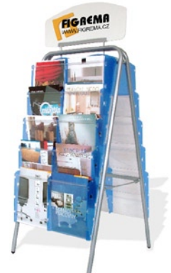
FGM A STOJAN (FGM A STAND) Kapacita: 2 x 10 kapes A4 Capacity: 2 x 10 pockets A4