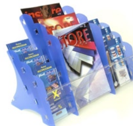
MK3 STOLNÍ SADA (MK3 TABLE SET) Kapacita: 3 x 3 x 25 mm tiskovin Capacity: 3 x 3 x 25 mm printed matters