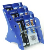
MK3 STOLNÍ A5 (MK3 TABLE A5) Kapacita: 3 x 25 mm tiskovin A5 Capacity: 3 x 25 mm printed matters A5