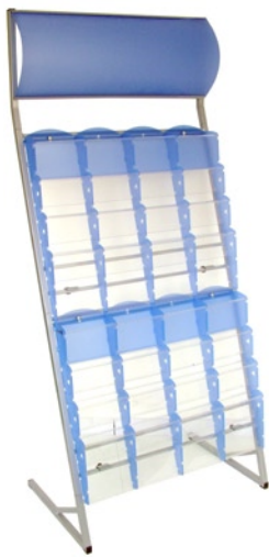
MK COBRA (MK COBRA) Kapacita: 8 x 4 kapes A4 Capacity: 8 x 4 pockets A4

MK 8 A5 PP Základní díl (Base column) Přídavný díl (Additional column)