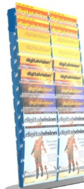
MK STOLNÍ (MK TABLE) Kapacita: 2 x 10 kapes A4 Capacity: 2 x 10 pockets A4