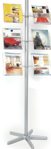
STOJAN BOW (BOW STAND) Kapacita: 6 kapes A4 Capacity: 6 pockets A4