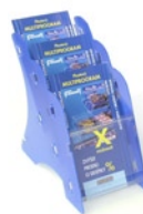
MK3 STOLNÍ DL (MK3 TABLE 110:210) Kapacita: 3 x 25 mm tiskovin DL Capacity: 3 x 25 mm printed matters