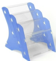
MK3 STOLNÍ A4 (MK3 TABLE A4) Kapacita: 3 x 25 mm tiskovin A4 Capacity: 3 x 25 mm printed matters A4